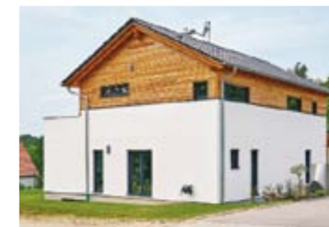
Der herausgezogene Wohnbereich, der hohe Kniestock und der knappe Dachüberstand weichen un-aufgeregt von der Bautradition ab.

Entwurf Schönberg Außenmaße 12,40 m x 8,34 m Wohnfläche 176,33 m 2 Kochen/Essen 28,04 m 2 Wohnen 26 m 2 Bad 1 20,06 m 2 (mit Sauna), Bad 2 4,52 m 2 Dach Satteldach 28° Neigung, U-Wert 0,17 W/m 2 K Bauweise doppelwandige Blockbohlenwand Twinligna, Außenwandstärke 34 cm, U-Wert 0,15 W/m 2 K Heizung Wärmepumpe/Fußbodenheizung, Gasbrennwertkessel, Stückholz-/Pelletskaminofen Vorzüge Kniestock 2,10 m, Einzelraumlüftungsanlage Preis ab 290.000 Euro (Ausbauhaus) Anbieter Sonnleitner GmbH & Co. KG Telefon 08542/96 11-0 E-Mail info@sonnleitner.de